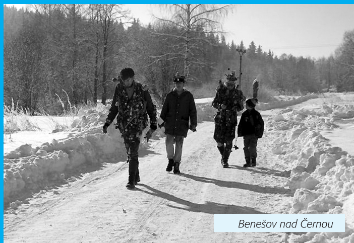
Benešov nad Černou