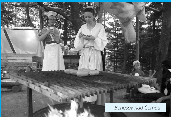
Benešov nad Černou