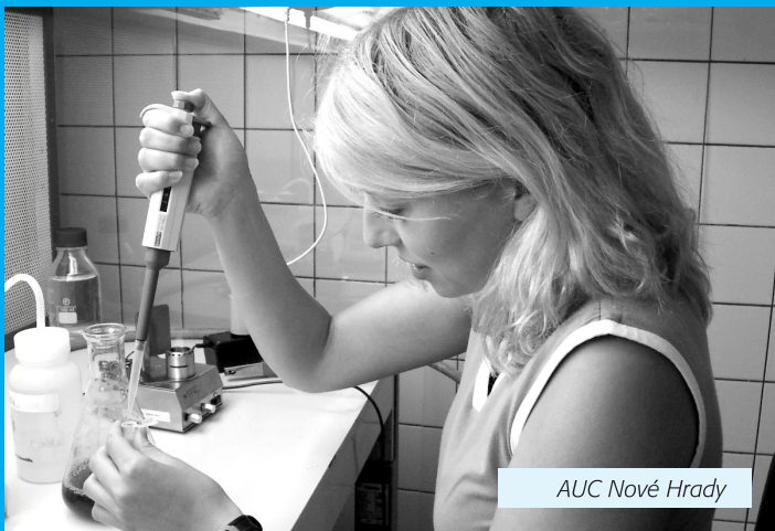
AUC Nové Hradky